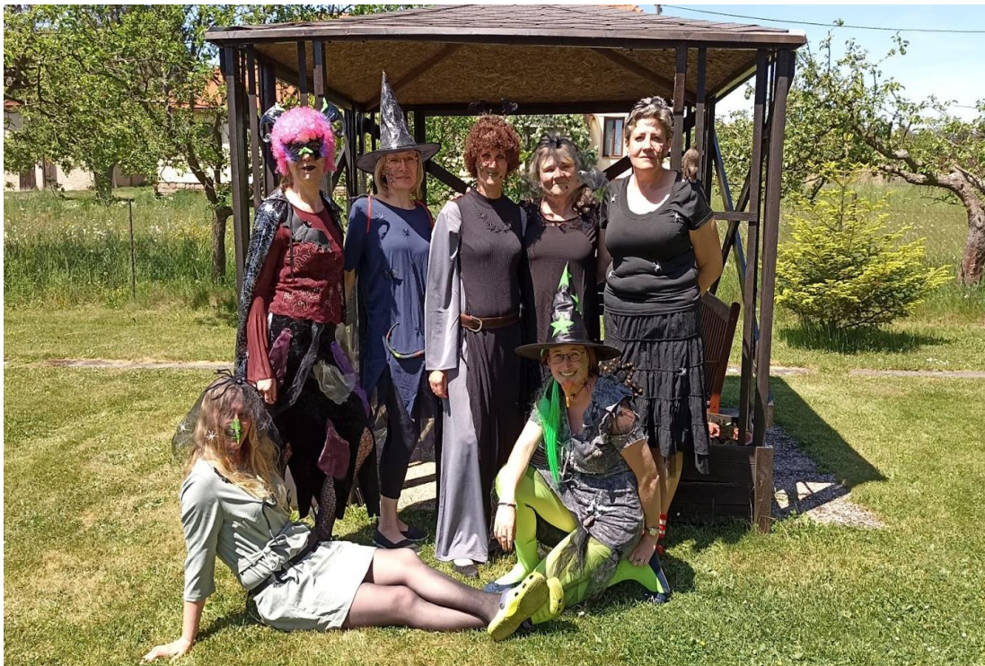
Pálení čarodějnic se vydařilo

Sociální kontakty v době zákazu návštěv byly zprostředkovány pomocí aplikace WhatsApp, kdy se klienti za pomoci personálu mohli se svými blízkými prostřednictvím tabletu vidět i slyšet.